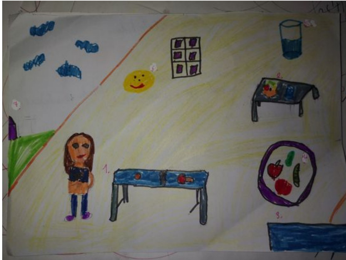
Smiltė Daunytė, 10 metų.