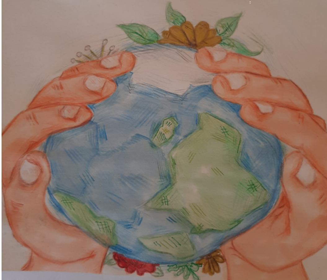
Ugnė Gilytė, 13 metų

Žemė, tai gyvybės išraiška. Neįmanoma jos nemylėti.